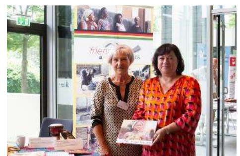
Im Gespräch mit MdB Bärbel Kofler