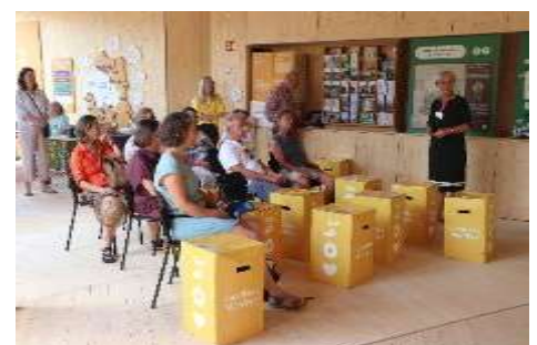
Besucher beim Vortrag

Der Landkreis München stellte seinen Pavillon auf der Landesgartenschau in Kirchheim den Kommunen zur Verfügung. Wir haben gemeinsam mit dem Fair Trade Team Unterschleißheim am Freitag, 19. Juli, das Programm gestaltet. In einem Vortrag wurde den Besuchern die Abfallentsorgung in Ghana vorgestellt.