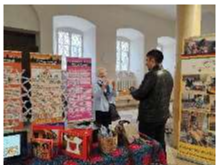
Lehrkräfte informierten sich

Veranstaltet wurde es vom Ökoprojekt MobilSpiel e.V. in Kooperation mit dem Münchner Referat für Bildung und Sport und dem Kreisjugendring München-Land am 24.10.2024 Uhr an der Städt. Salvator-Realschule.