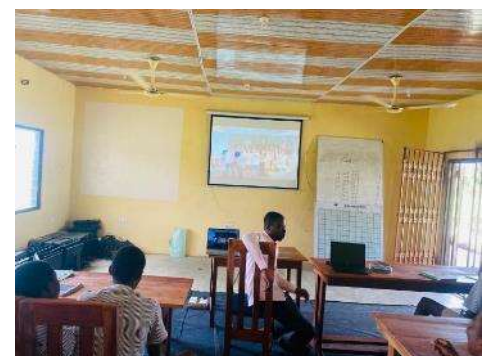
Präsentation des Videos in Dadoboe