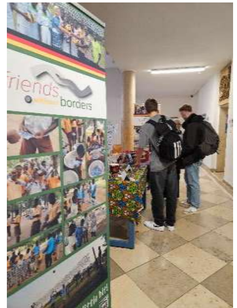
Auch Schüler waren an unserem Stand

Wir haben dort die Aktion „Volleyballnetz aus Plastikmüll“ als Best Practice-Projekt präsentiert und konnten vielen Interessenten – Schüler wie auch Lehrer - diese Idee vorstellen.