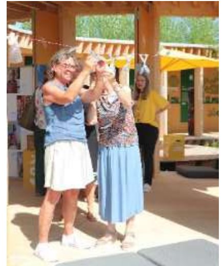
Besucher beim Weben des Netzes

Im Anschluss hatten die Gäste die Möglichkeit, aus ghanaischen Plastiktüten, die die 1. Vorsitzende im März von ihrem Besuch mitgebracht hatte, ein Volleyballnetz herzustellen.